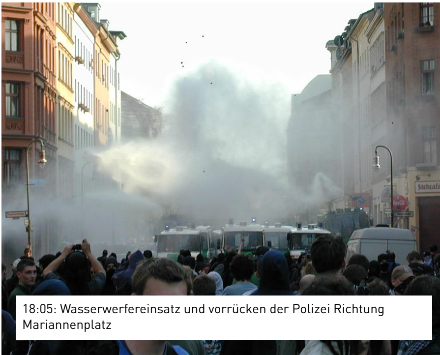
18:05: Wasserwerfereinsatz und vorrücken der Polizei Richtung Mariannenplatz

dem Mariannenplatz nur einige Beamte in Zivil postiert, um die Stimmung auf dem Fest nicht anzuheizen. Doch gegen 16.15 Uhr unterlief einem leitenden Polizisten ein schwerer Fehler. Aus einem