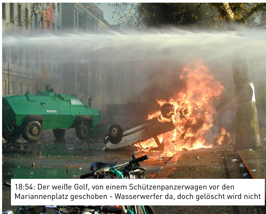
18:54: Der weiße Golf, von einem Schützenpanzerwagen vor den Mariannenplatz geschoben - Wasserwerfer da, doch gelöscht wird nicht