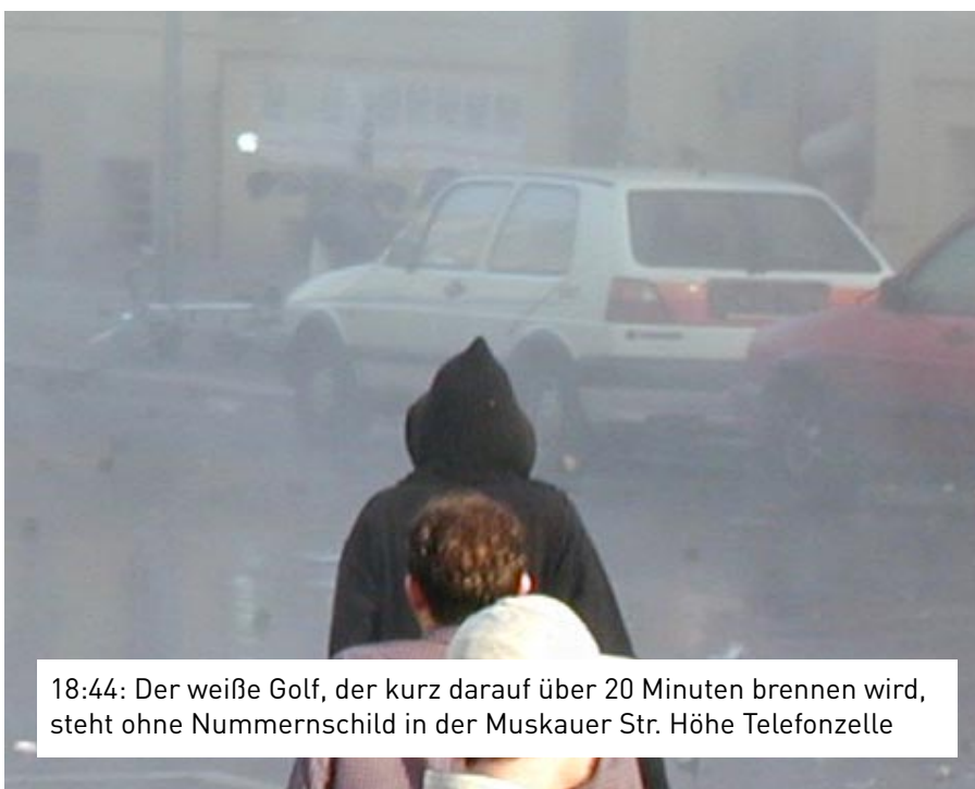
18:44: Der weiße Golf, der kurz darauf über 20 Minuten brennen wird, steht ohne Nummernschild in der Muskauer Str. Höhe Telefonzelle

Der Filmbericht der "Abendschau" war am späten Nachmittag des 1. Mai am