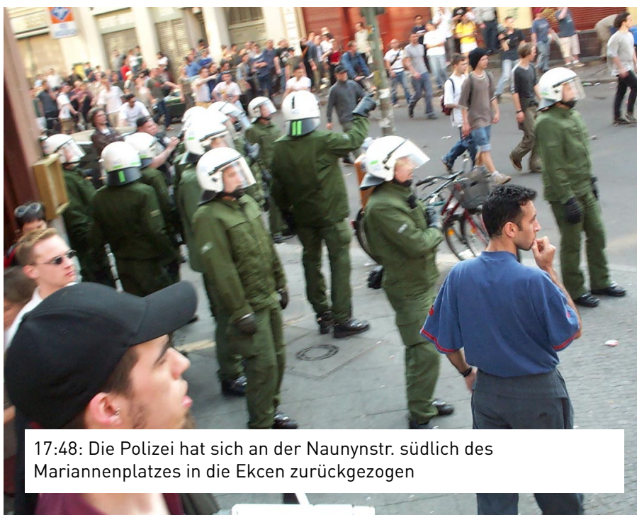
17:48: Die Polizei hat sich an der Naunynstr. südlich des Mariannenplatzes in die Ecken zurückgezogen

brennende Autos, cs-gas Einsatz, willkürliche festnahmen und Räumung des Mariannenplatzes (inclusive Volksfest), Einkesselung