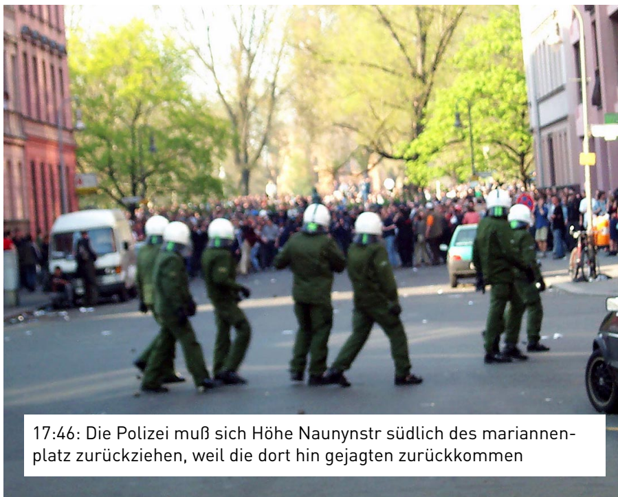
17:46: Die Polizei muß sich Höhe Naunynstr südlich des mariannenplatz zurückziehen, weil die dort hin gejagten zurückkommen

Die Beamten haben im Laufschrift aus der Oranienstr. kommend alle zwischen Heinrichplatz und Mariannenplatz befindlichen Personen auf den Mariannenplatz getrieben und dann im laufschrift versucht, den Mariannenplatz zu stürmen - auf dem immernoch völlig friedlich das Straßenfest ablief. Mittlerweile sind dort durch die Aufforderungen der Polizei und durch das Hintreiben der Leute, die am Heinrichplatz waren, sehr viele Menschen dichtgedrängt.