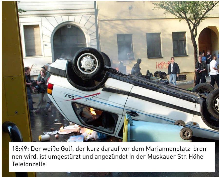
18:49: Der weiße Golf, der kurz darauf vor dem Mariannenplatz brennen wird, ist umgestürzt und angezündet in der Muskauer Str. Höhe Telefonzelle

Heinrichplatz aufgenommen worden. Die Aufforderung, sich zum Mariannenplatz zu bewegen, ist in Ton und Bild dokumentiert. Die gleiche Durchsage ist nach Informationen der taz zuvor auch an der Kreuzung Adalbert- und Oranienstraße und auf dem Lausitzer Platz gemacht worden.