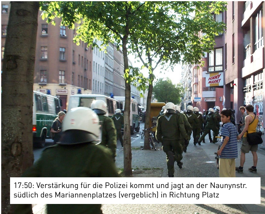
17:50: Verstärkung für die Polizei kommt und jagt an der Naunynstr. südlich des Mariannenplatzes (vergeblich) in Richtung Platz