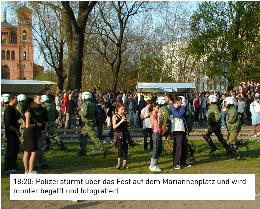
18:20: Polizei stürmt über das Fest auf dem Mariannenplatz und wird munter begafft und fotografiert

Nach Steinen hagelt es nun Kritik: Die Polizeitaktik am 1. Mai in Kreuzberg steht unter Beschuss. Von zentraler Bedeutung ist dabei eine Frage: Warum wurden gewaltbereite Demonstranten in der Oranienstraße per Lautsprecherdurchsage aufgefordert, sich in Richtung Mariannenplatz zu entfernen? Auf diesem fand zum selben Zeitpunkt ein friedliches Straßenfest mit mehreren tausend Besuchern statt. Kurz darauf kam es zur Eskalation. Die Polizei bestätigte gestern Abend ihre Durchsage. Diese habe aber nur "völlig friedlichen" Teilnehmern der PDS-Demonstration gegolten. Zudem habe man nur dazu aufgefordert, "sich in Richtung Mariannenplatz und nicht zum Mariannenplatz zu entfernen".