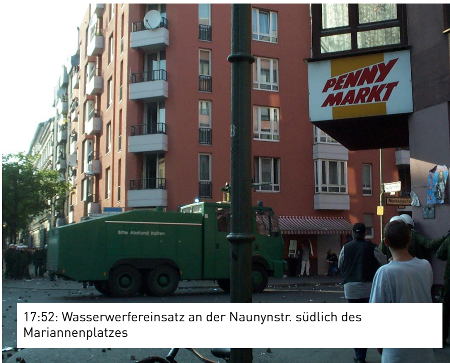
17:52: Wasserwerfereinsatz an der Naunynstr. südlich des Mariannenplatzes

seausweis deutlich sichtbar) fotografieren will, wird er aus dem Hof vertrieben. Die zweite Person wird von zwei Polizisten in die Mangel genommen, muß sich nach vorne beugen und die Polizisten stützen sich auf dem Festgenommen ab (mehrere Minuten). Als der Journalist Polizisten anspricht, bekommt er von einem die Antwort: »wenn dir das nicht paßt, bekommst du meine dienstnummer, dann kannst du dich beim polpräs beschweren.« Gibt die