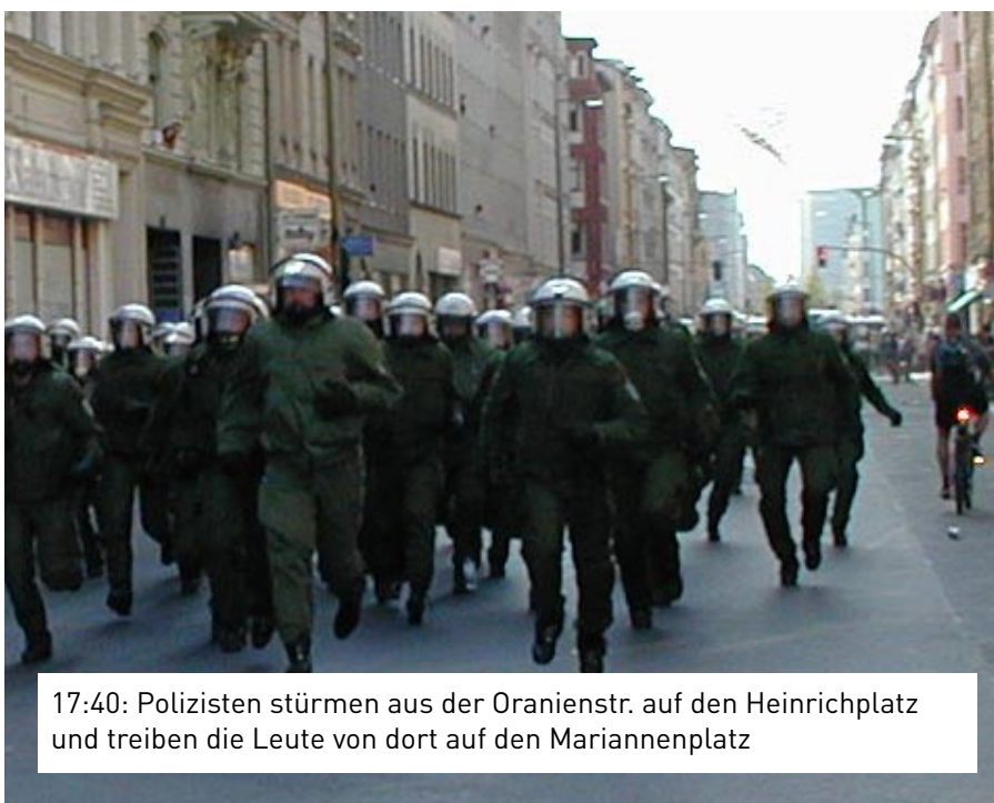
17:40: Polizisten stürmen aus der Oranienstr. auf den Heinrichplatz und treiben die Leute von dort auf den Mariannenplatz

Bis gegen 17:40 (fast 1,5 Stunden später) war alles ruhig, zwischen Heinrich und Mariannenplatz standen und liefen sehr viele Leute hin und her, es war Volksfeststimmung.