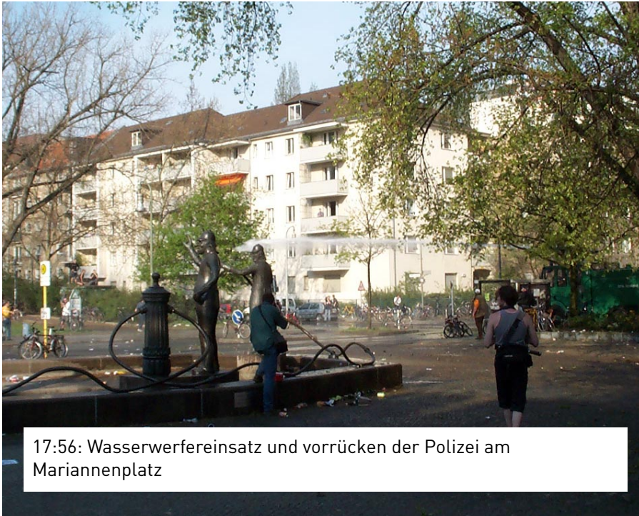
17:56: Wasserwerfereinsatz und vorrücken der Polizei am Mariannenplatz

Randalierer festgenommen wurden. Ein offenbar überfordertes Polizeiführer musste abgelöst werden. Daraufhin kam es zu gravierenden Kommunikationsproblemen zwischen der Führung und den einzelnen Polizeitrupps, so dass der Einsatz nur mangelhaft koordiniert werden konnte. Die Polizei wies die Vorwürfe zurück.